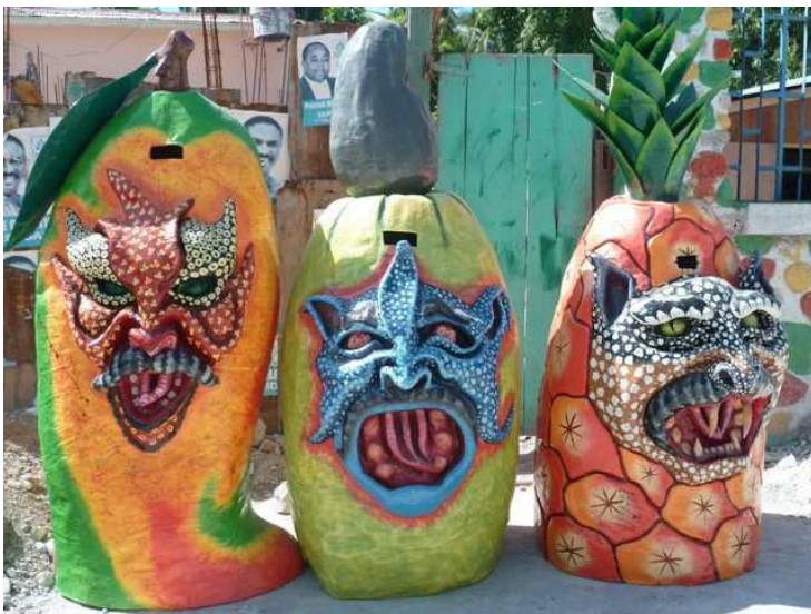
Photo du Carnaval de Jacmel