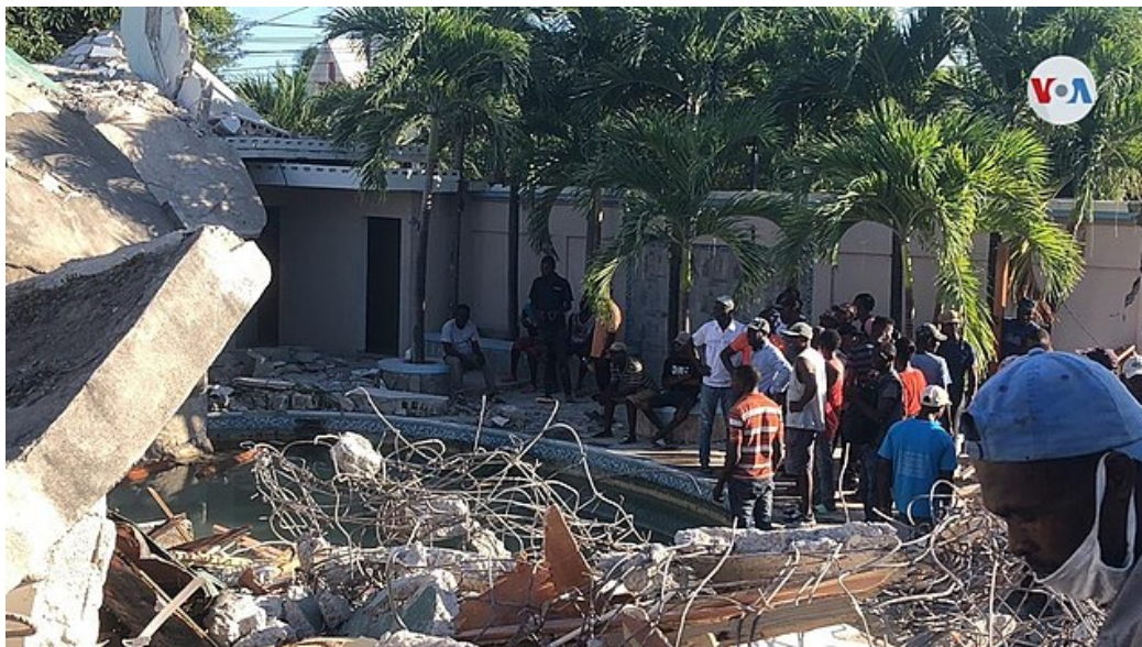
14 août 2021